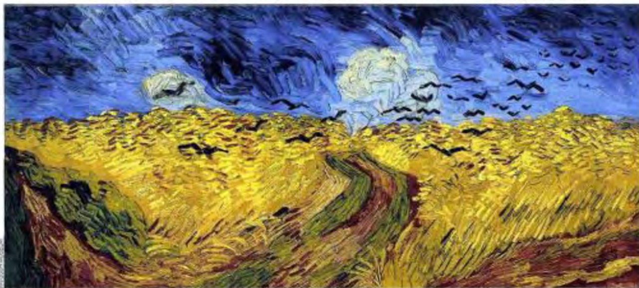
CHAMP DE BLÉ OUIX CORDEAUX 1890

Meet Vincent , jusqu'au 25 septembre, au musée Van Gogh, à Amsterdam. www.vangoghmuseum.nl/en