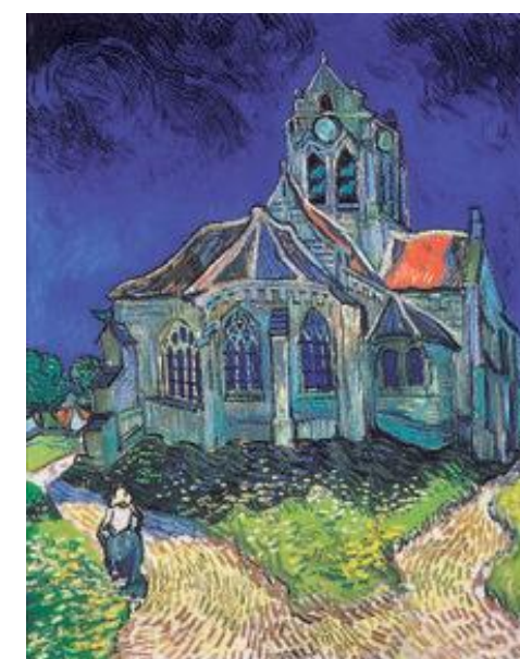
Het kerkje van Auvers zoals Van Gogh het schilderde in 1890.

Verzakt, beschimmeld en een boom door het dak