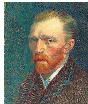
Van Gogh ligt in een verzakkend graf.

aanvraag gedaan”, zegt de Française lichtelijk wanhopig tussen haar dossiers. „Als het goed is draait de staat op voor 40 procent van de kosten en het departement voor nog eens 20 procent. Ik hoop een vijfde met giften bij elkaar te krijgen en een vijfde betaal ik zelf. Ik wacht dus op 120.000 euro. We zijn een inzamelingsactie begonnen, sinds de zomer zitten we op 14.000 euro. Wat zal ik zeggen... het begint op gang te komen.”